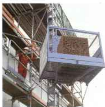
Zahnstangenaufzüge mit Stahlmast