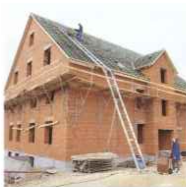
Schrägaufzüge mit Seil