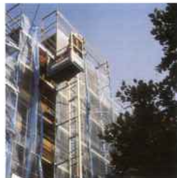
Schräg- und Senkrechtaufzug mit Zahnstange