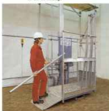
Zahnstangenaufzüge mit Aluminiummast