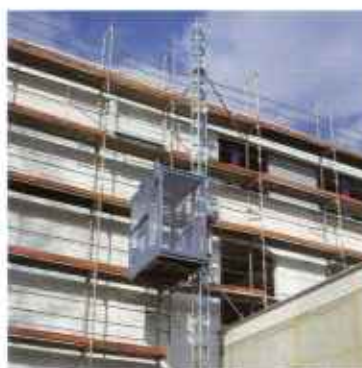
Personen- und Lastenaufzüge